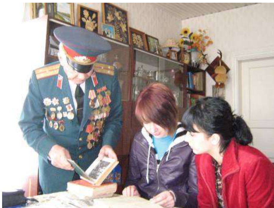
В гостях у ветерана...